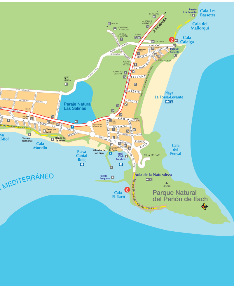
TABLA ECO RUTAS FAMILIARES CALP