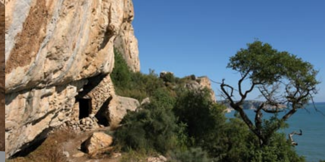
La ruta de los acantilados del Moraig a la Cala de Llebeig.

El camino continua pasando por debajo del arco formado por las peñas. A partir de aquí, la senda se bifurca: podemos seguir