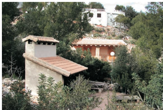
Zona de acampada del Tossal del Llop en Adsubia