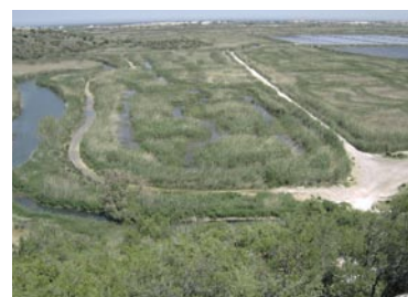
Carrizal y ullals en el marjal.

Volvemos hacia atrás y cruzamos de nuevo la pasarela. Seguimos paralelos al río y vemos una caseta de cemento (30,15) con una persiana metálica y unos grafittis . Seguimos por el camino a la izquierda. Llegamos a la CV-678 (31,42) , giramos a la derecha y a los pocos metros (31,56) por el primer camino de tierra a la izquierda. Vamos ahora entre campos de arroz por un camino de tierra. Llegamos a una caseta de color verde que es una estación de bombeo (33,12) , giramos a la izquierda y enseguida a la derecha para continuar paralelos al canal de riego, llegando al final del mismo (33,94) al río Racons, que recorre el